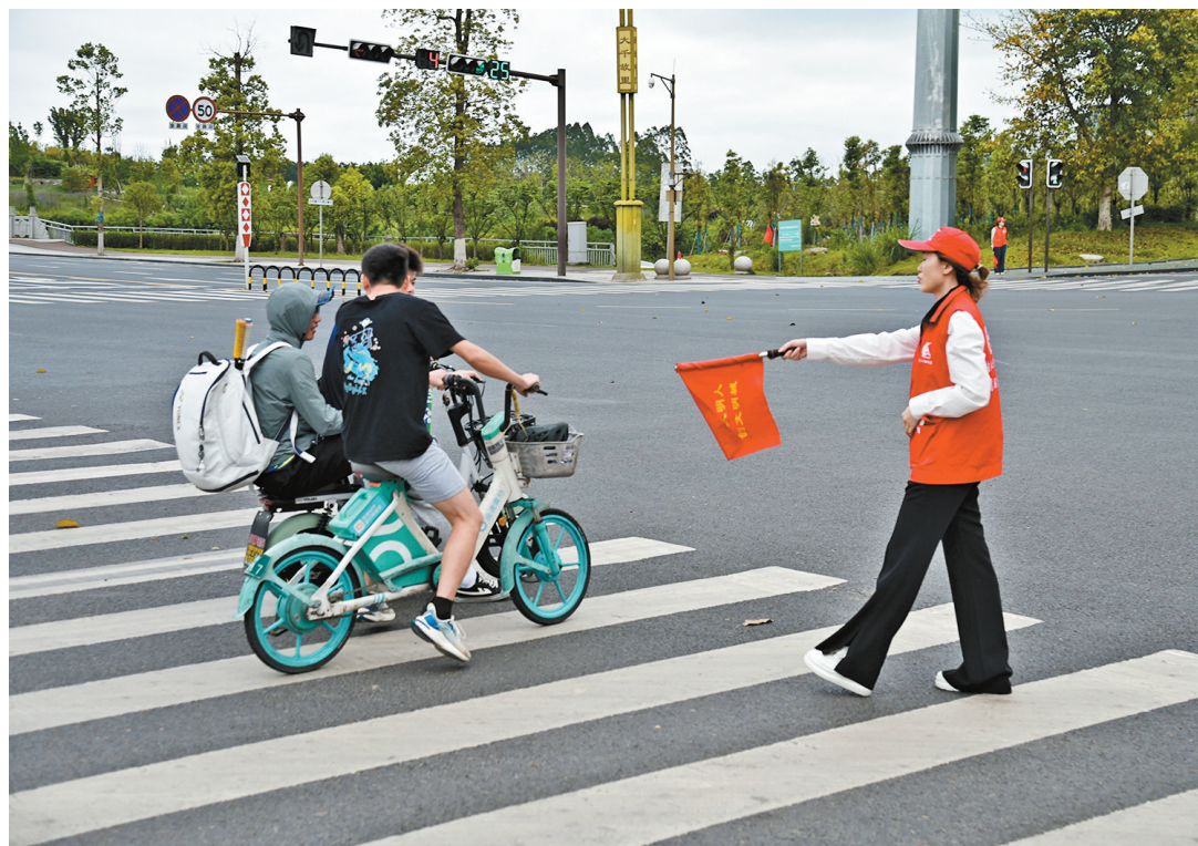
劝导行人等候红绿灯

本报讯(内江日报全媒体记者 罗佳)4月29日,“让文明出行成为甜城靓丽风景”文明实践日活动继续开展。来自市级各机关企事业单位的志愿者走上街头,持续开展文明劝导志愿服务。