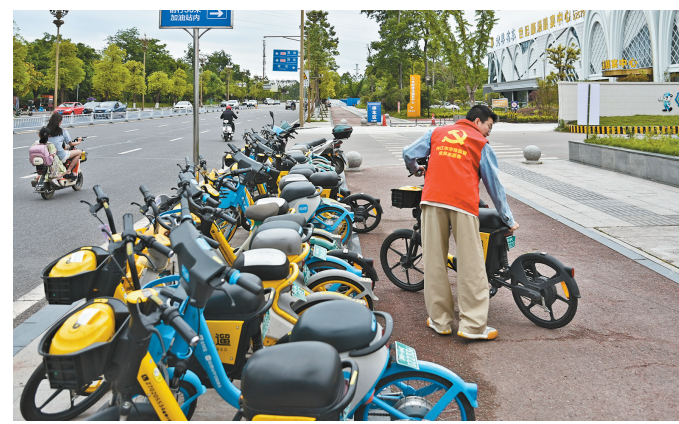
规范共享单车停放