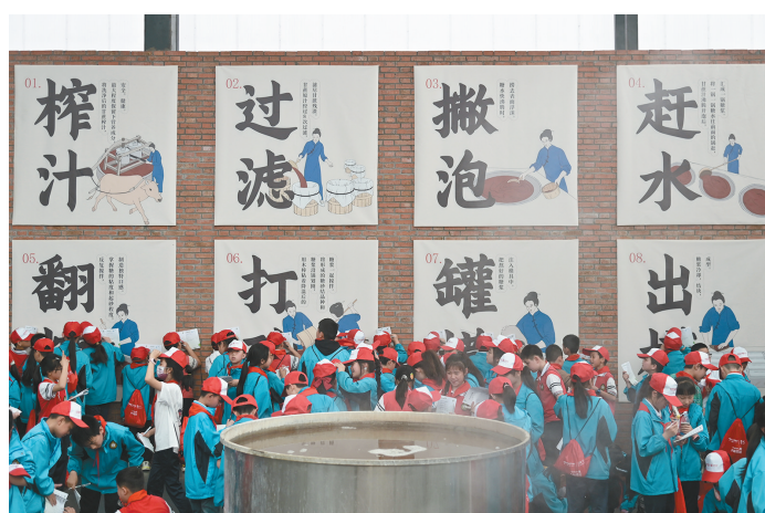
了解红糖制作工艺