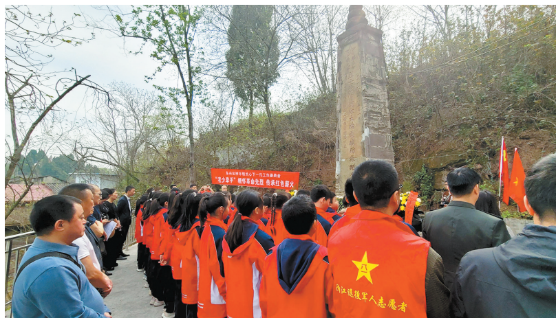
瞻仰成渝铁路沱江大桥烈士纪念碑