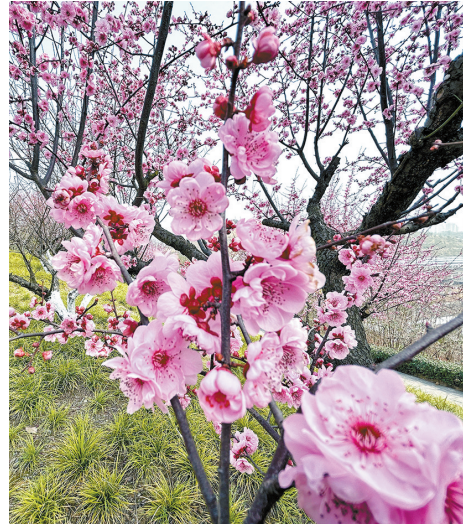
▲春色正盛 ▲花开正艳 ▲游客赏花