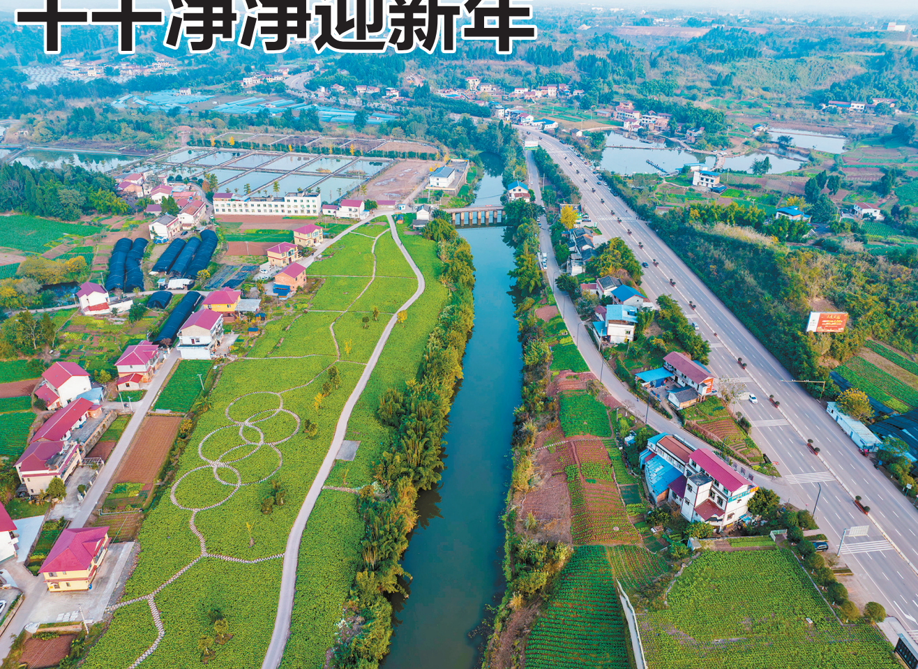
高桥街道俯瞰图