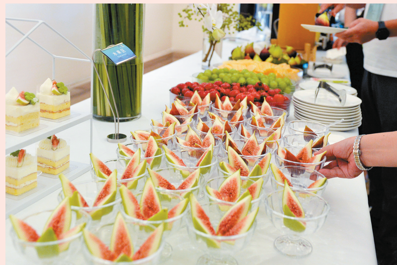
2023年8月15日,2023年世界无花果大会在威远举行。无花果优质的品质受到国内外嘉宾的称赞。