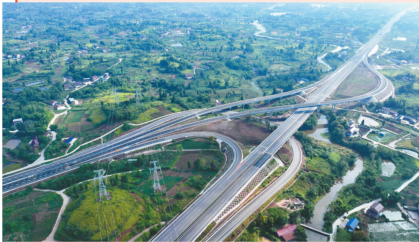
2023年9月14日,内江至大足高速公路东兴枢纽。9月15日零时,内大高速正式并网通车,内江市到重庆市主城区车程从原来的90分钟缩短至60分钟,到大足车程仅30分钟。