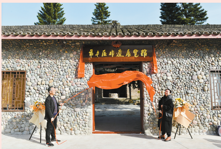
2023年11月16日,市中区非遗展览馆在市中区凌家镇大湾村开馆。该展览馆由甜味、甜艺、甜文三大板块组成,集中展示市中区33个非遗项目。