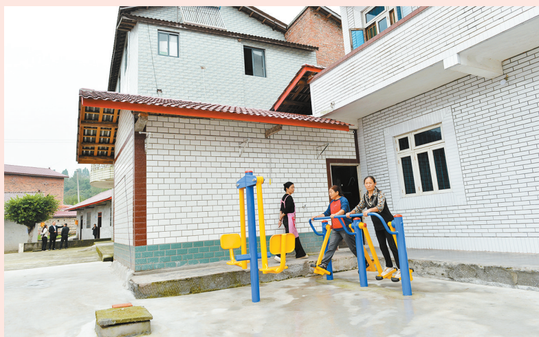
2023年10月11日,内江高新区高桥街道风庙社区邓家大院的村民在院坝锻炼。内江实施农村面貌改善行动以来,农村人居环境得到较大改善,村民幸福指数得到极大提升。