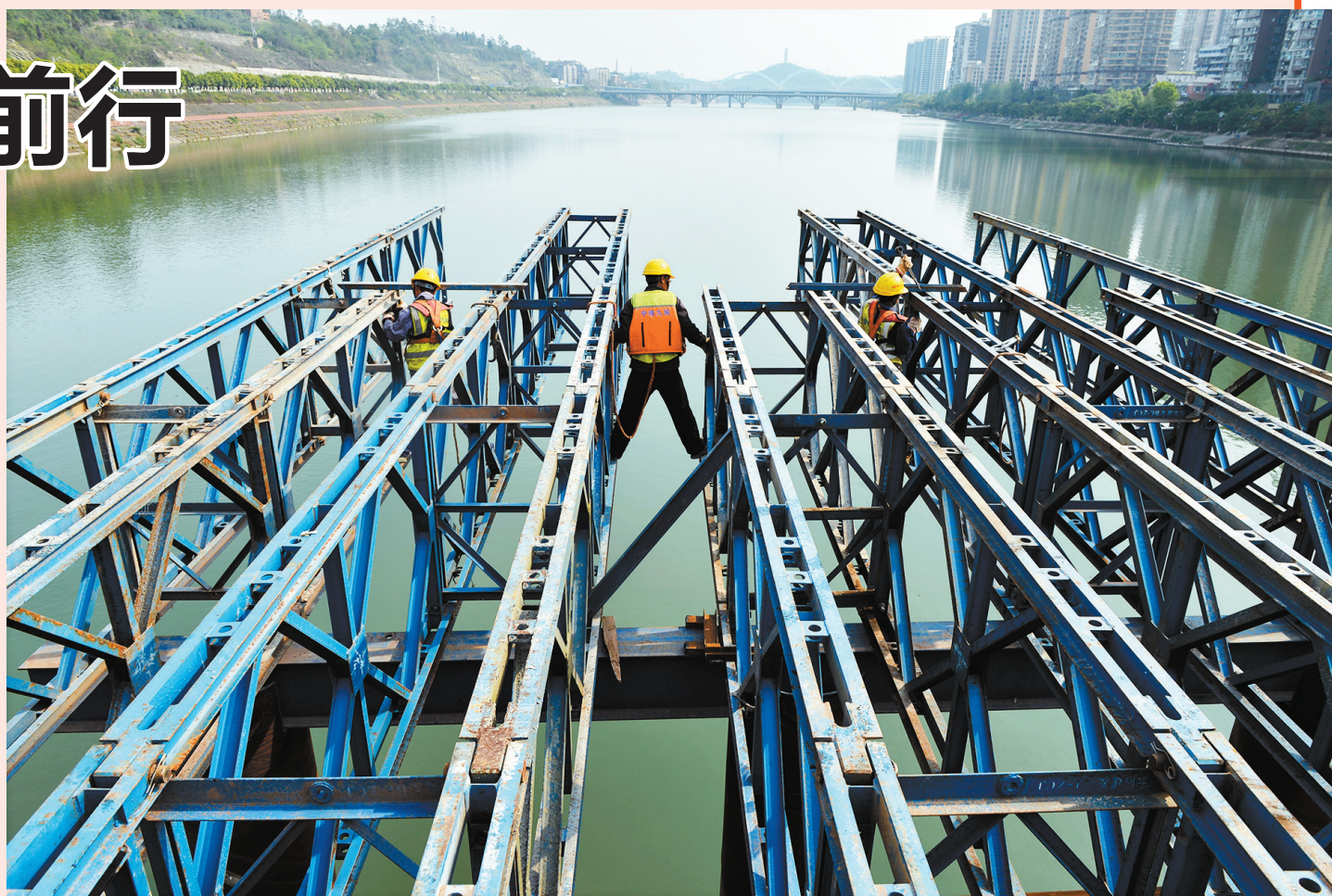
2023年5月1日,内江麻柳坝大桥的建设者在加班加点建设大桥。内江麻柳坝大桥预计2024年竣工通车。