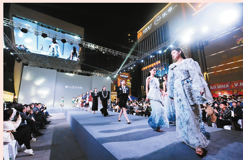
2023年12月8日晚,“内江首届高校艺术·文化·消费节暨内江职业技术学院文旅学院2024届服装专业优秀毕业作品发布会”在万晟天街举行。