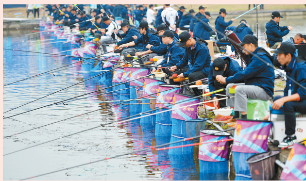
2023年4月21日,内江市欢庆“五一”职工钓鱼比赛在隆昌举行,全市200名职工运动员参加比赛。