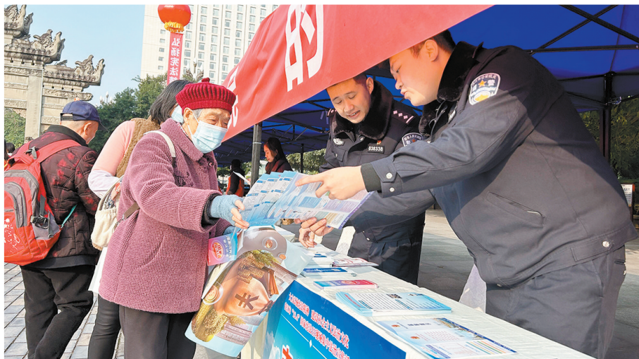
工作人员向群众宣传法律知识

除举办此次集中法治宣传活动,主办方还紧扣“大力弘扬宪法精神,建设社会主义法治文化”主题,通过重要路段和地区的LED屏,以及组织开展宪法宣传进学校、进乡村(社区)、进企业、进网络等主题活动,广泛宣传宪法所确立的国家根本制度、根本任务、基本原则、活动准则等,进一步提升公民对宪法的关注度和认知度,让更多人了解宪法、尊重宪法,共同维护宪法尊严,为奋力谱写中国式现代化内江实践新篇章营造了浓厚法治氛围。