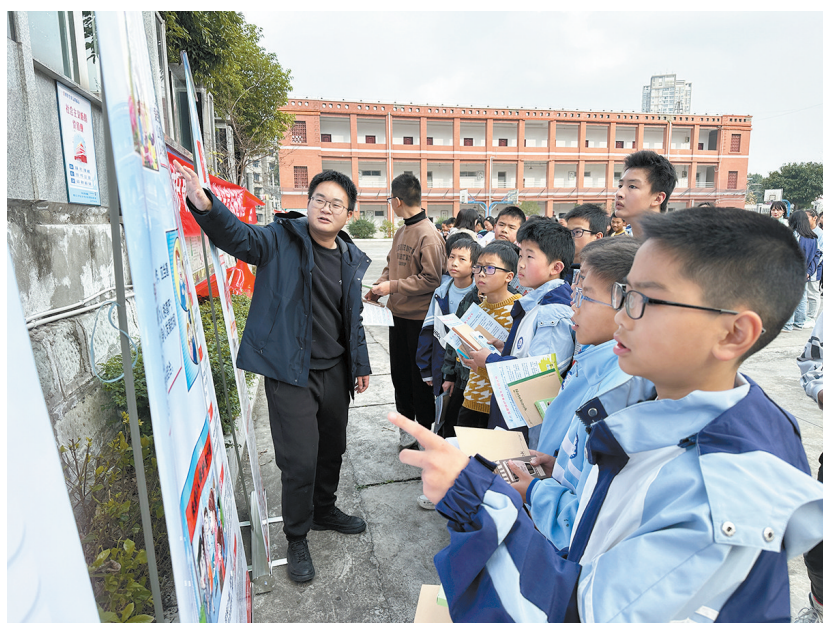
普法志愿者向学生们讲解宪法知识

在有奖答题环节中,学生们举手作答普法志愿者提出的法律知识题目,答对可领取精美礼物,答错由志愿者面对面解析。学生们纷纷比学赶