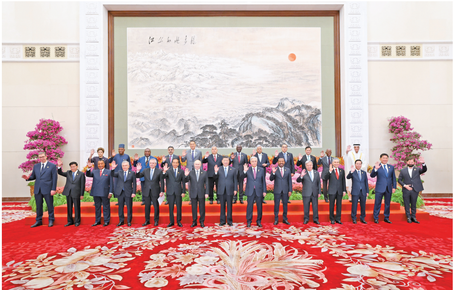
10月18日上午,国家主席习近平在北京人民大会堂出席第三届“一带一路”国际合作高峰论坛开幕式并发表题为《建设开放包容、互联互通、共同发展的世界》的主旨演讲。