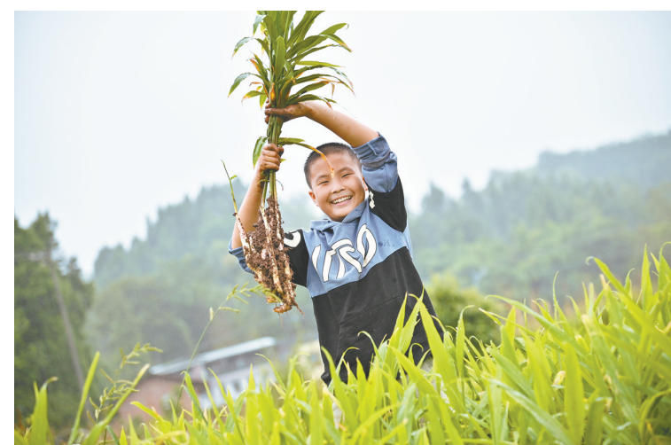
亲手采挖成就感满满

专社+基地+农户”经营管理模式，引导电商企业以委托生产、订单农业等方式形成“点对点”产销合作，根据市场需求开发泡姜、生姜洗发水等产品，推动了“永福生姜”特色农产品高