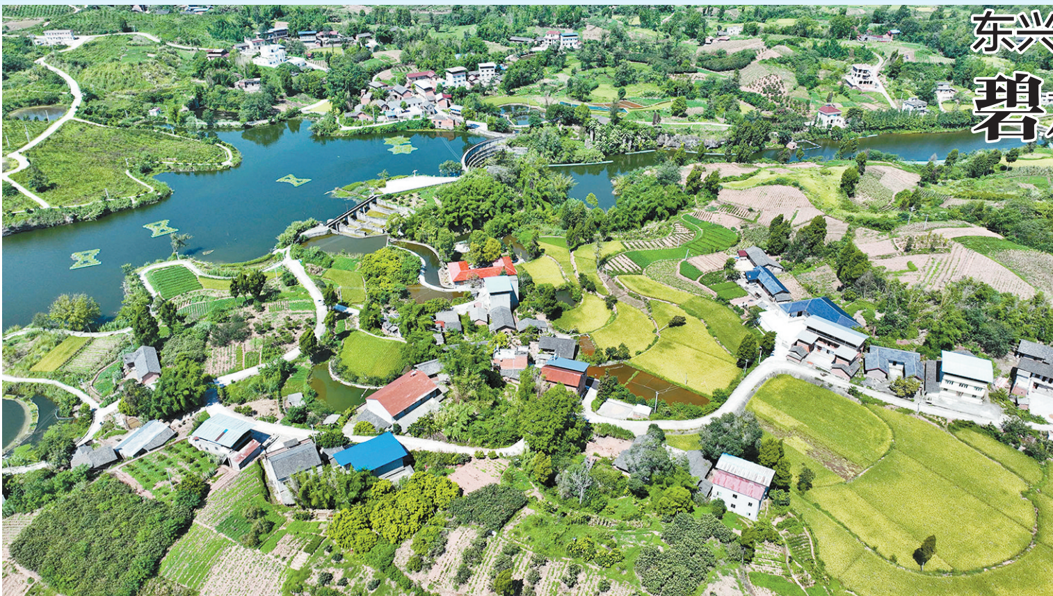
水库环绕的莲花村