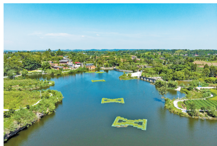
莲花台水库生态浮床