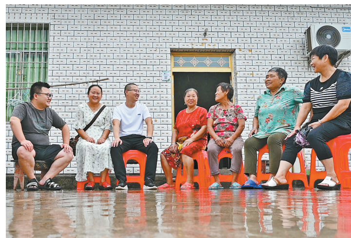
院坝会商讨庭院建设

据悉，全市农村面貌改善行动实施以来，内江高新区高桥街道以狠抓农户自筹资金为突破口，将宣传思想舆论引导作为总的发动机，将农村面貌改善行动工作政策、“六净六顺”工程、“八个一”标准等融入到大小会议、入户走访、个别交流谈心全过程，引导干部群众把思想和行动进一步统一到市委、区委的决策部署上来，统一到真心实意为群众办实事和推进乡村振兴的实践中来，按照“五个美”的要求，共建宜居宜业和美乡村，共步幸福美好生活。