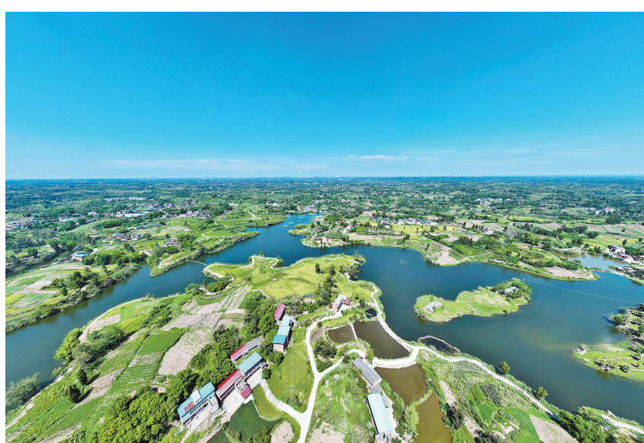
青山绿水与蓝天白云相映成景

8月10日，东兴区永兴镇莲花村航拍的莲花台水库，一湖碧水与蓝天白云相映成景，构成一幅美丽的乡村画卷。